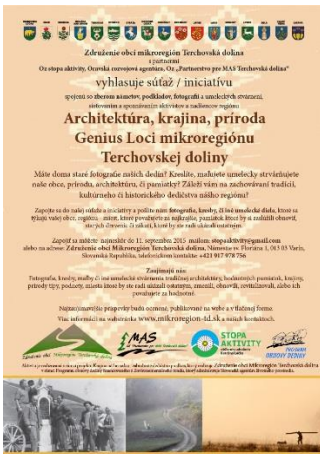
PLAGÁT K INICIATÍVE