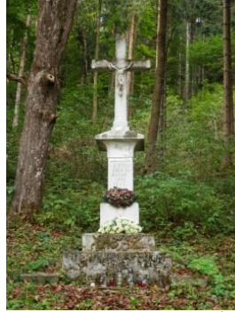
MAPOVANIE DROBNÝCH SAKRÁLNYCH PAMIATOK SKAUTI

Kríž: "O JEŽIŠU ZMILUJ SA NAD NAMI ANNO 1923"