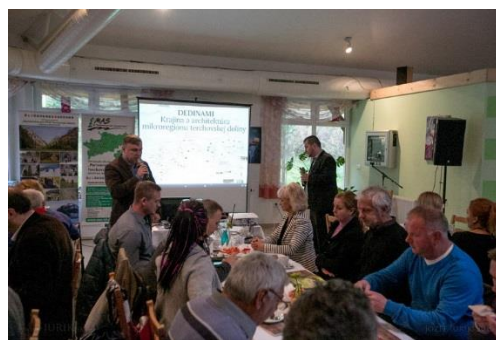
ODBOBNÝ SEMINÁR - TERCHOVÁ 21.10.2015