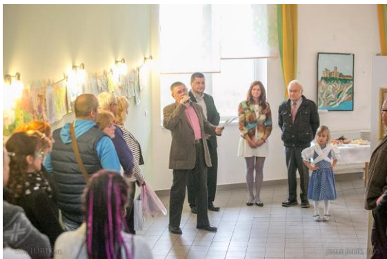
VERNISÁŽ VÝSTAVY REGIONÁLNYCH VÝTVARNÍKOV