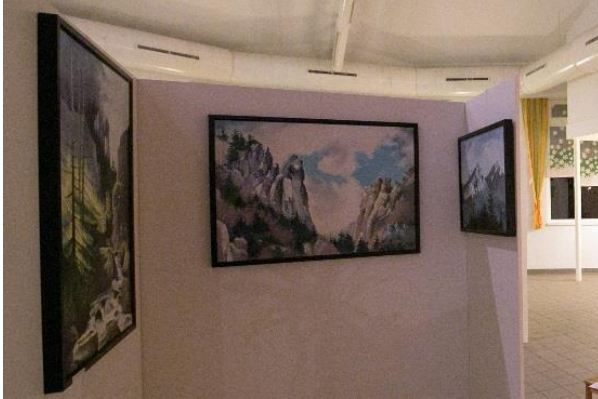
VYSTAVENÉ OBRAZY FRANTIŠEK MUCHA