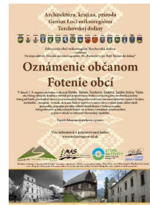
OZNAM O FOTENÍ OBCÍ