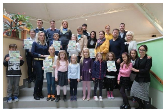
OCENENÉ DETI VO VÝTVARNEJ SÚŤAŽI