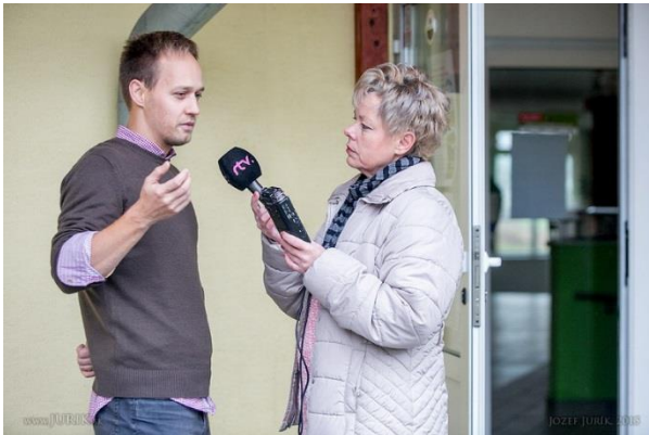
PUBLICITA PROJEKTU - ROZHOVOR RTVS