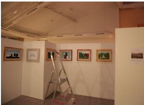
INŠTALÁCIA VÝSTAVY VÝTVARNÍKOV

49°15'36.6"N 19°01'40.6"E 49.260174, 19.027950